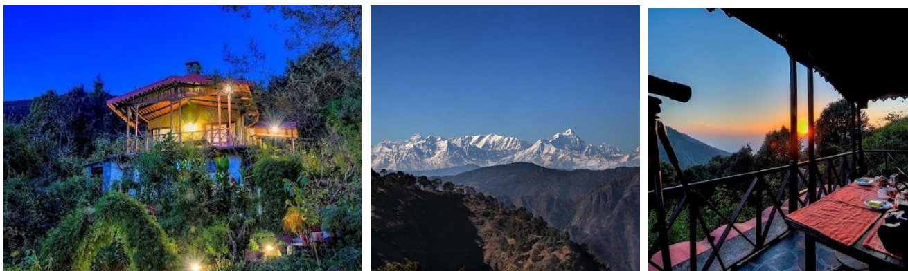
ÖVERNATTNING: JUNGLE LORE BIRDING LODGE, PANGOT

Tidig fågelskådning vid floden Kosi innan resan går vidare till Pangot tre - fyra timmar med stopp efter vägen för fågelskådning. Pangot är en av norra Indiens många byar som ligger i det gröna Himalaya och känslan av att befinna sig på en mycket avlägsen plats infinner sig snabbt här där cirka 250 olika fågelarter finns; några exempel; Lammergeier , Griffon , Blue-winged Minla , Woodpecker , Khalej Pheasant , Rufous-bellied Niltava .