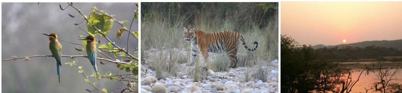
Corbett Nationalpark – Foton: Kjell Borneland Swed-Asia Travels