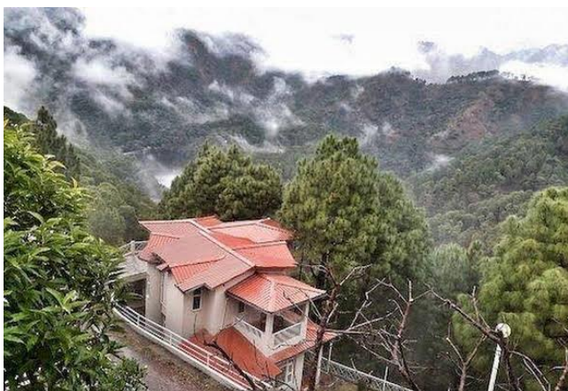
Er lodge: V Resort, Sattal

ÖVERNATTNING: V RESORT ELLER LAVANYA RESORT